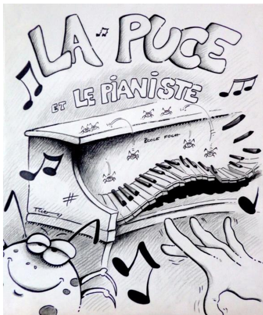
Affiche réalisée par Thierry Thibouret