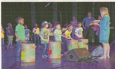
Les élèves aux percussions, après le chant, se sont baignés dans la culture brésilienne pendant tout un après-midi.